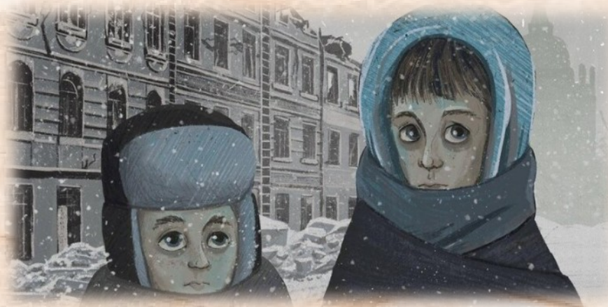
Мемориал «Разорванное кольцо»